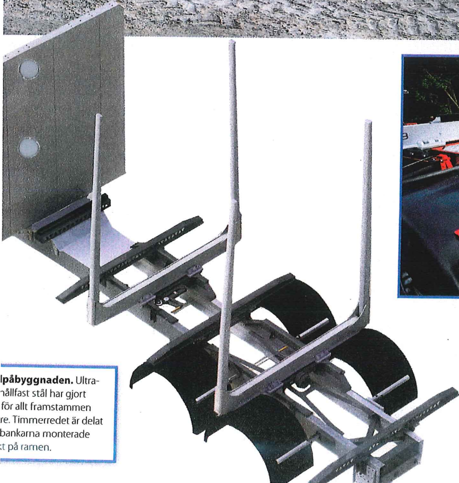
► Ipåbygggnaden. Ultra- rällfast stål har gjort för allt framstammen re. Timmerredet är delat bankarna monterade st på ramen.