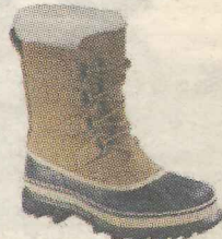
Sorel Caribou W Pris: 1500,-