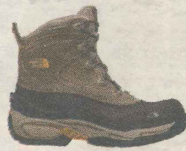
The North Face Off Chute Pris: 1295,-